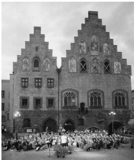
2. Classic OpenAir im Juli 2000 vor dem Rathaus

Vor der malerischen Kulisse des Rathauses konnten erstmalig im Sommer 1996 die drei bekannten Blasorchester aus Rohrdorf, Eichenau bei Fürstentfeldbruck und Wasserburg am Inn das Publikum zum Classic OpenAir begeistern. Es wurde eine Großbühne vor die Rückwand der Frauenkirche gebaut. Der Abend versprach eine anspruchsvolle Werkauswahl. Viele Zuschauer waren gekommen. Stehende und sitzende Zuhörer (ca. 1500) konnten gespannt in der Abenddämmerung klassischen Werken des Großorchesters lauschen. Dargeboten wurden unter anderem die geschichtsträchtige „Ouvertüre 1812“ und Georg Friedrich Händels bekannte „Feuerwerksmusik“. Dieses Spektakel wurde dankenswerter Weise von den Böllerschützen Evenhausen und Griesstätt mit Kanonenschüssen eindrucksvoll unterstützt. Diese konnten vom Dach der Kernhausfassade ein einzigartiges Erlebnis untermalen, ebenso wie die Kirchenglocken in der Stadt.